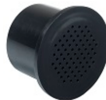
Filtre à charbon actif - FILTRE1 Il est recommandé de le changer tous les ans.

** Grâce à l'application Vinotag®, bénéficiez d'un registre digital de votre cave et soyez alerté des dates d'apogée de vos vins. En partenariat avec Vivino scannez votre bouteille pour accéder à sa fiche vin préremplie.