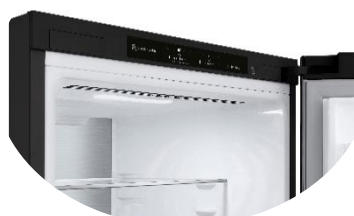
Affichage intérieur discret