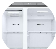
Affichage intérieur discret