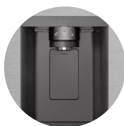
Distributeur d'eau épuré