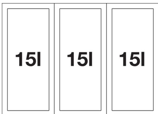
Vue de dessus