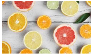
2 cônes : petits et grands agrumes