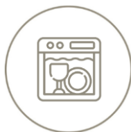
Accessoires compatibles lave-vaisselle (hors petit dôme)