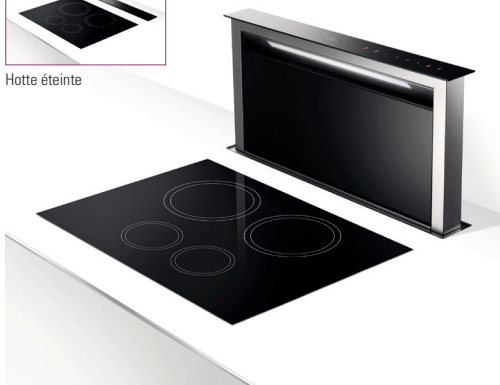
Hotte en fonctionnement