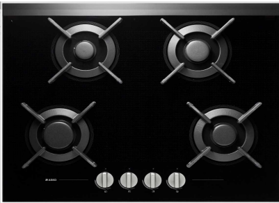
Table de cuisson à gaz 741475 HG8640BGB1