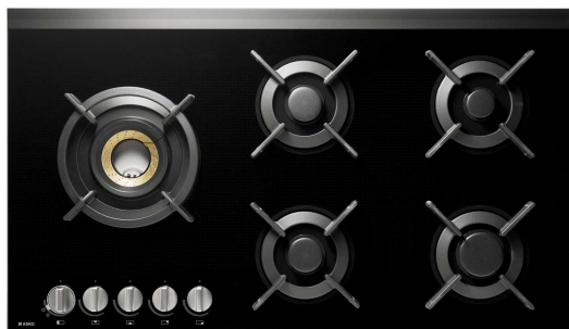
Table de cuisson à gaz 741477 HG8953BGB1