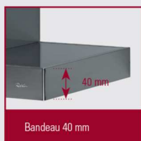
Bandeau 40 mm