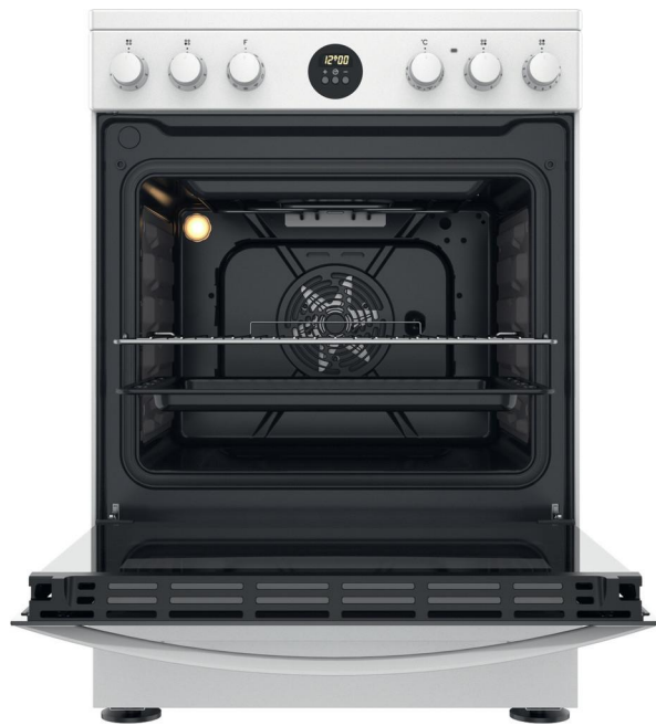
TABLE DE CUISSON