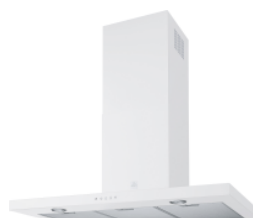
Blanc (900 mm)