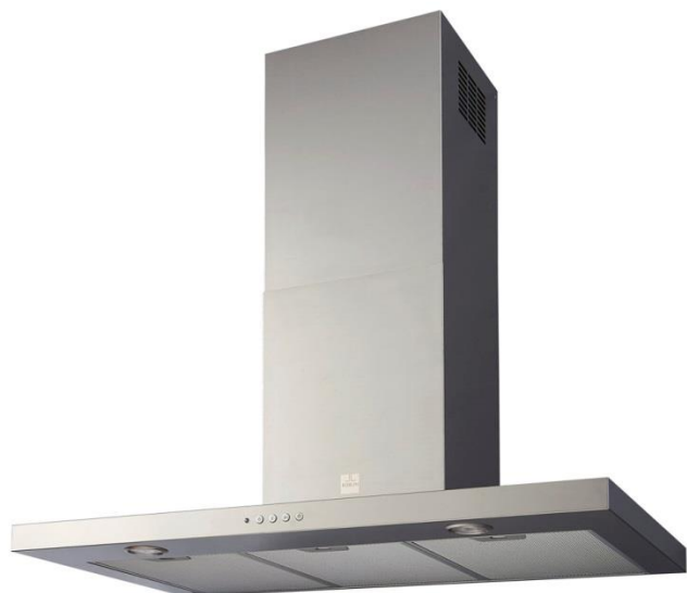
Inox (900 mm)

Hotte box murale en inox ou en acier 600 et 900mm