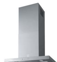
Inox (600 mm)