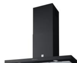
Noir (900 mm)