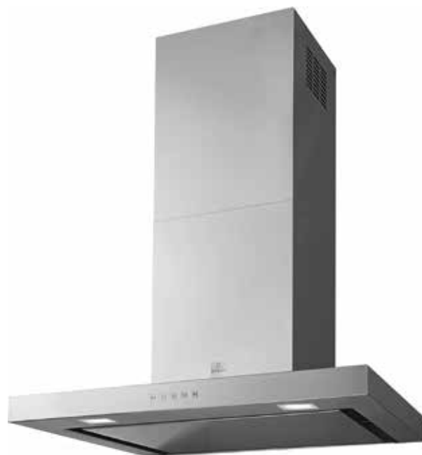
Inox (700 mm)