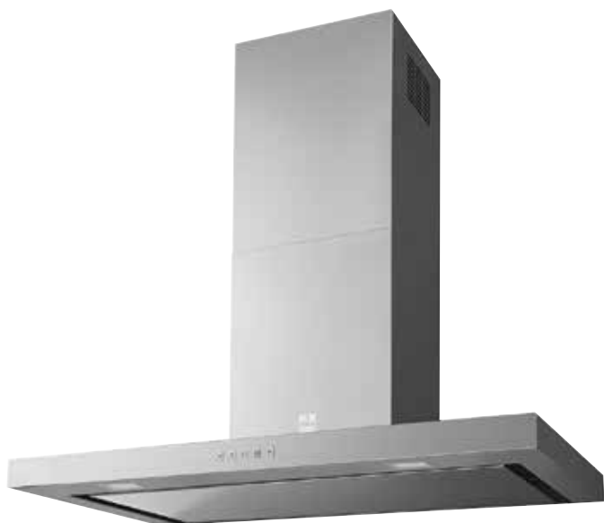
Inox (900 mm)