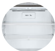
Distribution d'air froid Multi Air Flow™