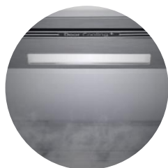
Éclairage Soft LED