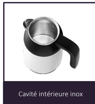
Cavité intérieure inox