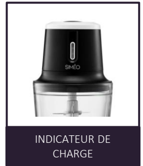
INDICATEUR DE CHARGE