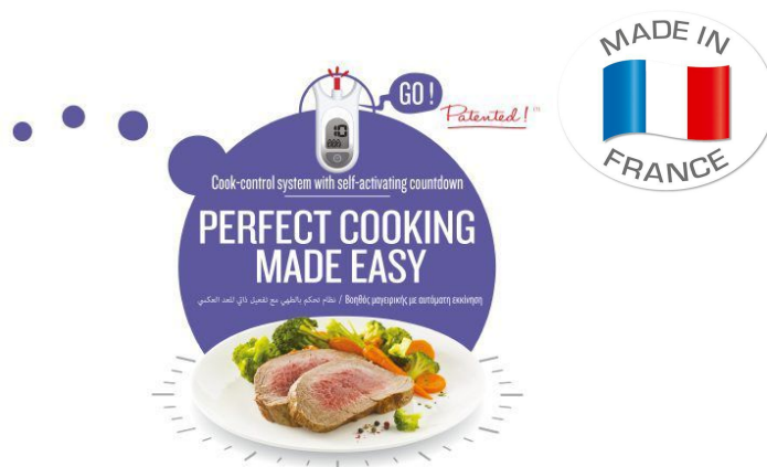
CLIPSOMINUT' PERFECT 9L CLIPSO MINUT PERFECT 9L VIOLET FR P4624900