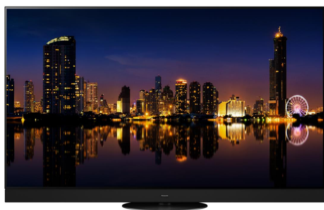
TX-55MZ1500E EAN : 5025232949427

Vos films et séries en HDR10, HDR10+ ou Dolby Vision bénéficieront toujours du meilleur rendu possible. Le capteur de luminosité intégré permet d'adapter l'image HDR en fonction de la luminosité de votre salon.